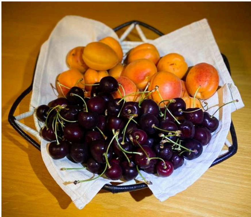
Albicocche Marchesini 2,70€ al kg