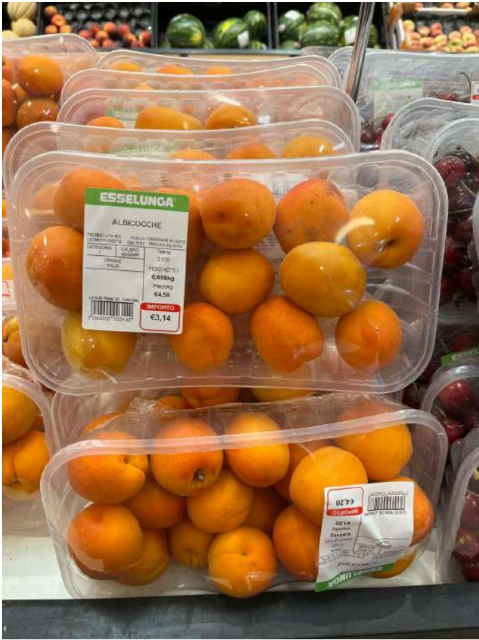
Gdo convenzionale 4,58€ al kg